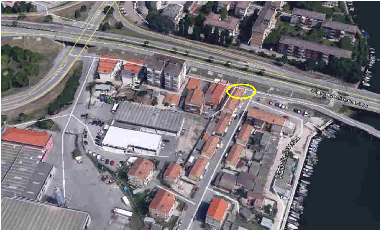
Immagine da satellite